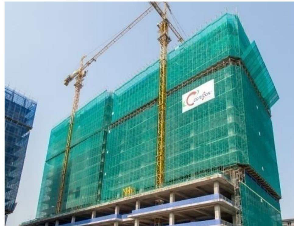
Bảng hiệu công ty