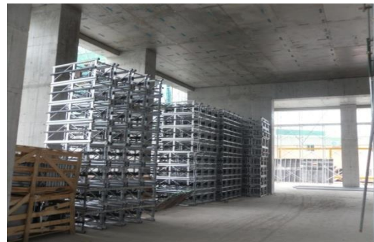
Bãi tập kết vật tư