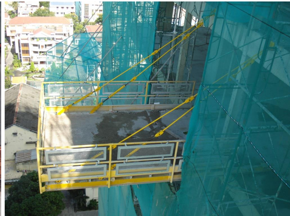
Sàn thao tác