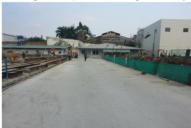
Lối đi trên công trường