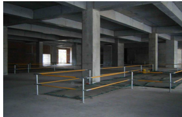
Lan can an toàn