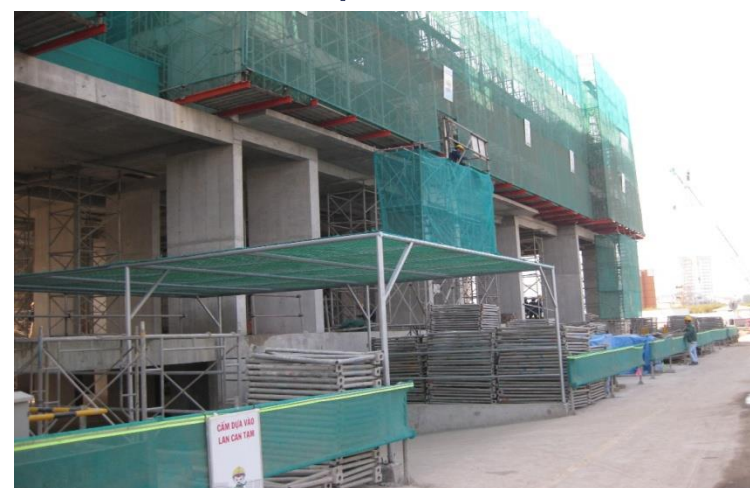
Lối đi trên công trường