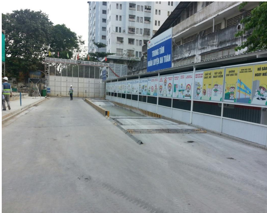
Bảng cảnh báo hướng dẫn