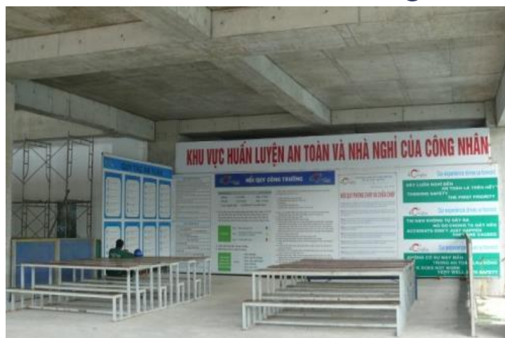
Khu vực huấn luyện an toàn