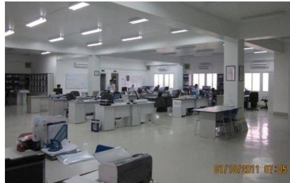
Khi thi công phần thân