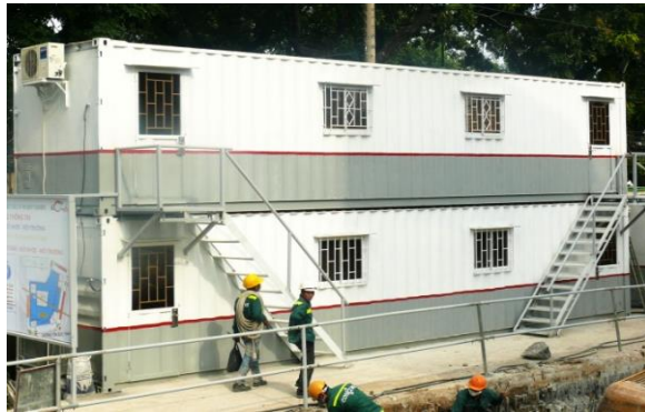
Khi thi công tầng hầm

Đối với công trường có mặt bằng chật hẹp