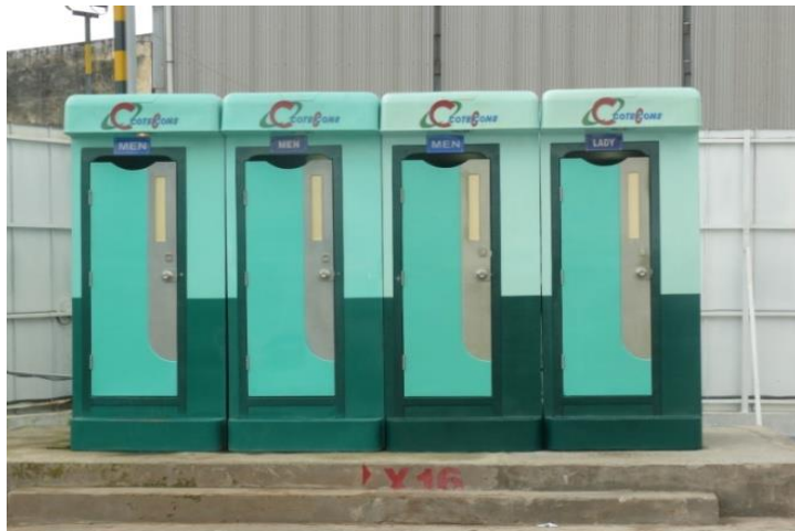
Nhà vệ sinh di động