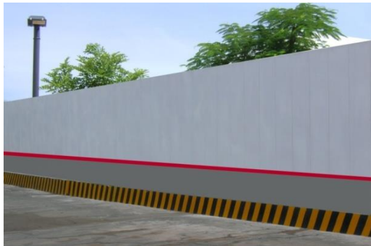
Hàng rào quanh công trường