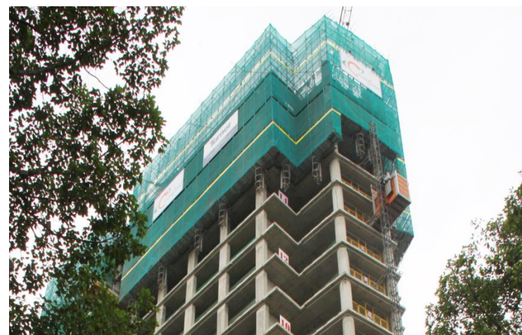
Giàn giáo bao che